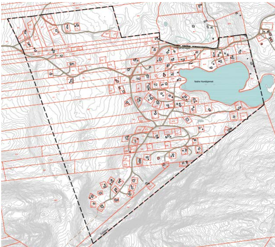
Planområde m/ sort stiplet

Det vil bli en ny runde for å kunne gi merknader til planen, ved offentlig ettersyn, trolig vinter 2017 – 2018. Både godkjent reguleringsplan fra 2005 og nytt kartgrunnlag sees på vår hjemmeside.