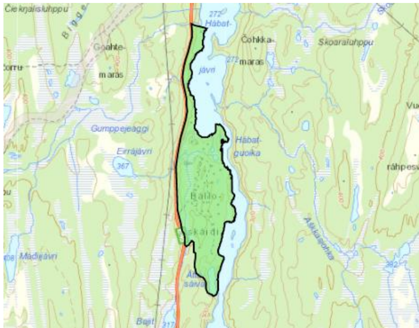
Figur 1 Friluftsområde FB3

Videre er det flere registrerte kulturminner, registrert som ulike fangstanlegg. Troms og Finnmark fylkeskommune, samt Sametinget vil kontaktes for avklaringer.