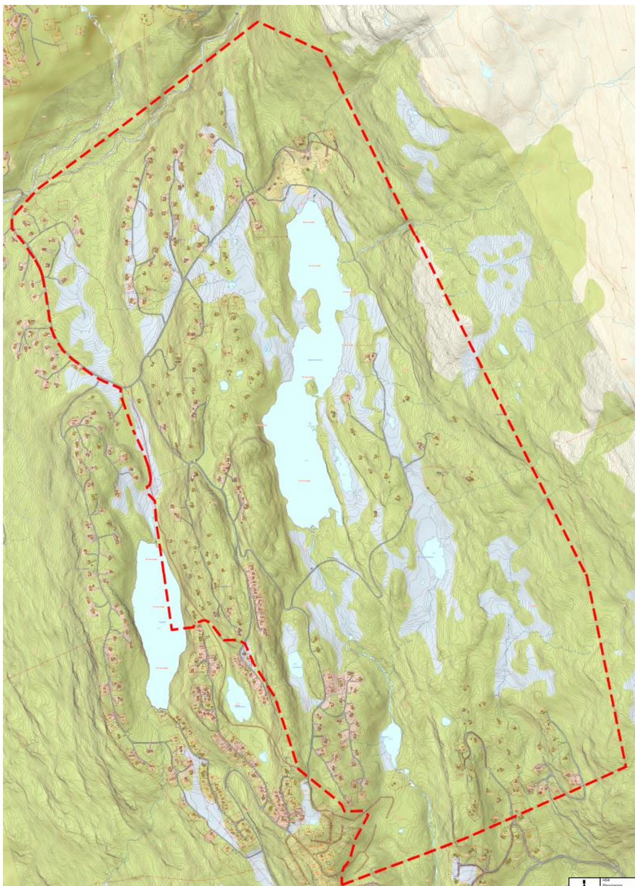
Figur 2 Planavgrömsnin