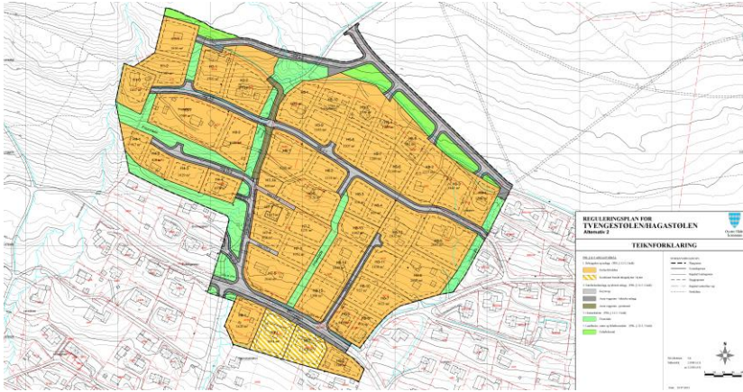
Utsnitt av gjeldende plankart

Reguleringsplanen ble opprinnelig vedtatt av Øystre Slidre kommunestyre 30.4.2015 sak nr 14/15.