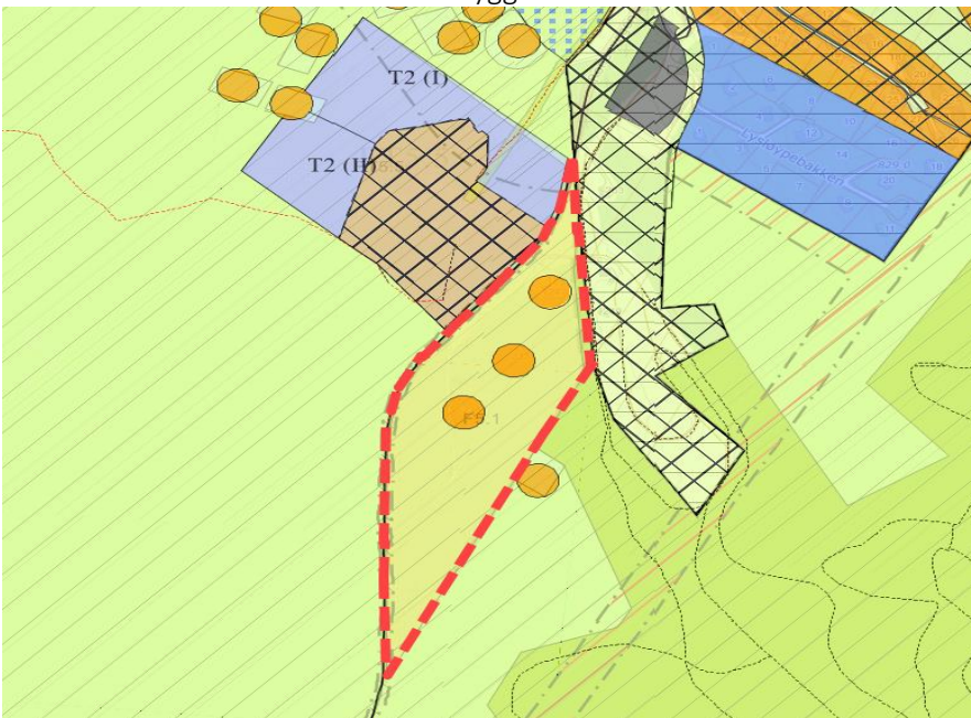
Utsnitt av kommuneplanen. Planavgrensning markert med rød linje. Byggeområde markert med gult.

Arealformålene innenfor planområdet er fritidsbebyggelse og idrettsanlegg. Det er kun planlagt bebyggelse innenfor område avsatt til fritidsbebyggelse.