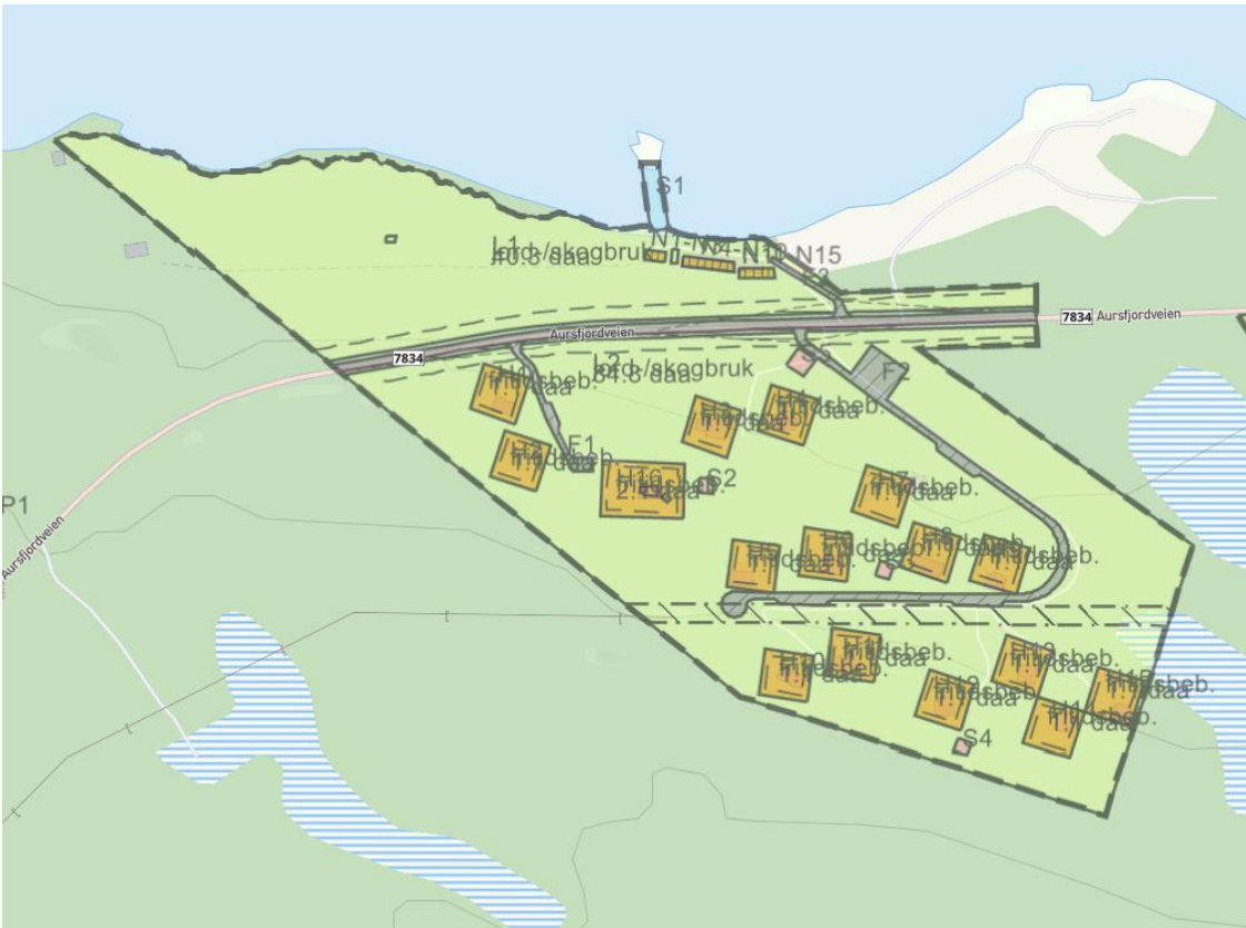
Figur 2: Gjeldende reguleringsplan for Tømmervika.